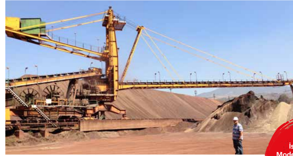
İstifleyici Modernizasyonu Stacker Modernization