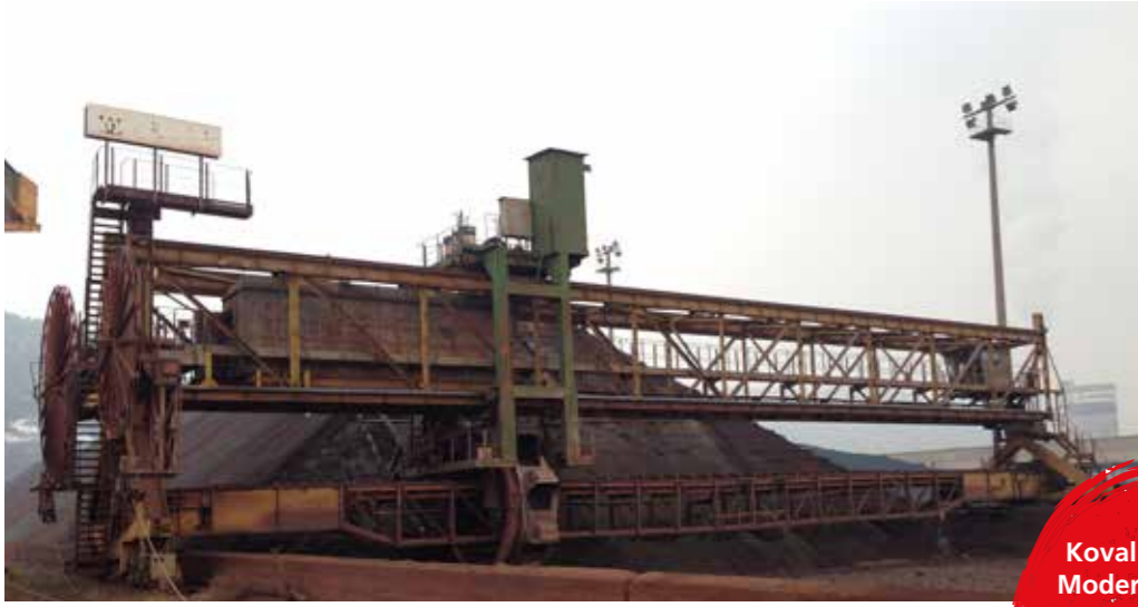
Kovalı Toplayıcı Modernizasyonu Bucket-Wheel Reclaimer Modernization